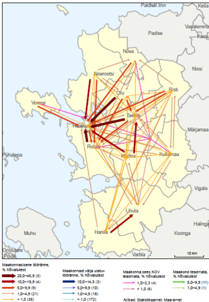
Allikas: Rahva ja eluruumide loendus 2011. Ülevaade omavalitsusüksuste töörandest, lk 10

Omavalitsuste halduskorraldus, mis ei ole kooskõlas tänase tegeliku asustumustri ja elanike reaalsete kommunikatsioonipiirkondadega, ei vasta kaasaegsetele vajadustele. Ridala valla elanikud, kes oma igapäevases tegutsemises on tihedalt seotud Haapsalu linnaga, kasutavad sealseid teenuseid ja infrastruktuuri, ei oma võimalust nende teenuste ja infrastruktuuri ehk laiemalt elukeskkonna kujundamisel kaasa rääkida. Inimeste osalemine oma elukeskkonna